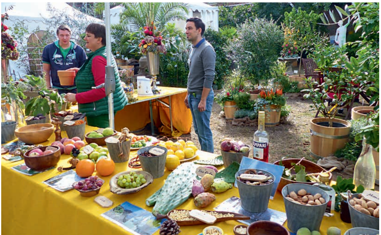
Abb. 17: Der Palmengarten mit seinem Informationsstand auf dem Fürstlichen Gartenfest auf Schloss Wolfsgarten.