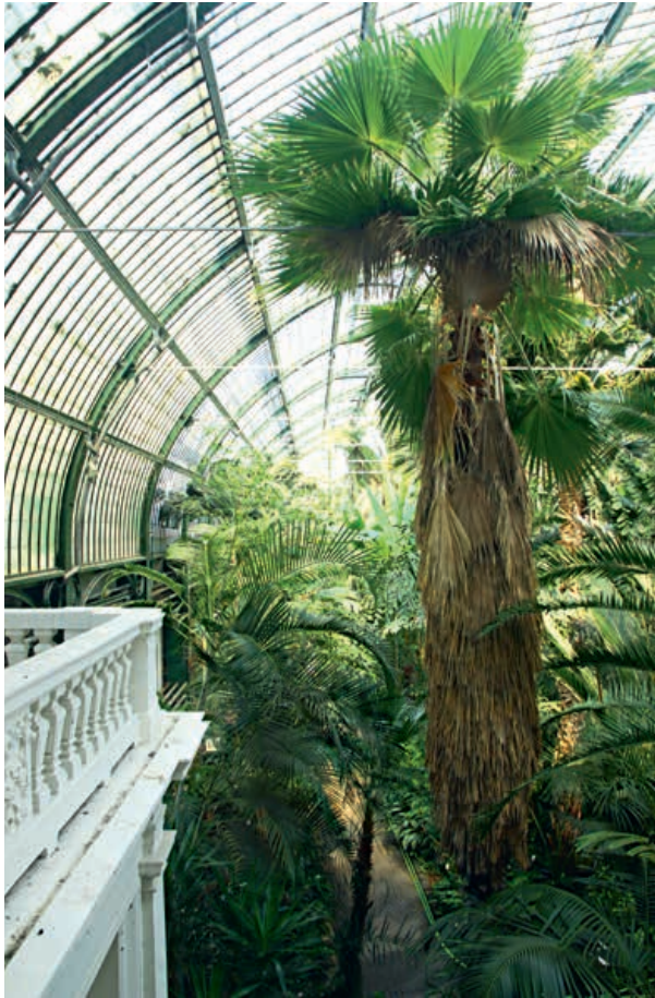
Abb. 3: Wenn es draußen ungemütlich ist, lohnt sich ein Besuch der Schauhäuser sehr, hier ein Blick vom Festsaal in das Palmenhaus.