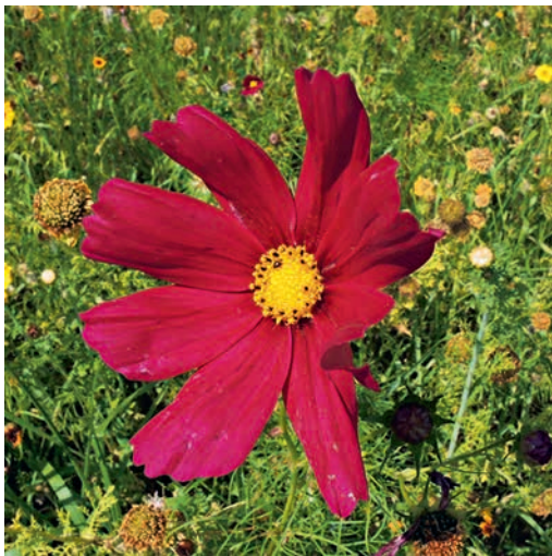
Abb. 6: Cosmos bipinnatus (Schmuckkörbchen, Bochum, 18.07.2018).

regelmäßige Vertreter sind Agrostemma gracile (Zierliche Kornrade, Türkei, Israel), Amaranthus caudatus (Garten-Fuchsschwanz, Südamerika), Ammi majus (Große Knorpelmöhre, Mittelmeergebiet), Calendula officinalis (Garten-Ringelblume, Herkunft unbekannt), Convolvulus tricolor (Dreifarbige Winde, Mittelmeergebiet), Coreopsis tinctoria (Färber-Mädchenauge, Nord-Amerika), Cosmos bipinnatus (Schmuckkörbchen, Nord- & Mittel-Amerika), Dianthus barbatus (Bart-Nel-