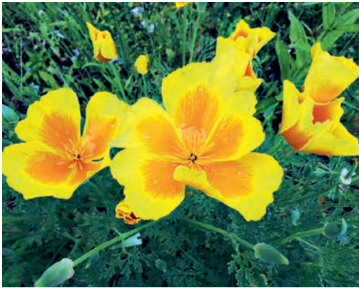
Abb. 7: Eschscholzia californica (Kalifornischer Kappenhahn, Bielefeld, 29.05.2016).

Vermutlich wurden vor allem Arten ausgewählt, die sich effektiv vermehren und deren Samen sich entsprechend kostengünstig herstellen lassen. Möglicherweise stammt ein nicht unerheblicher