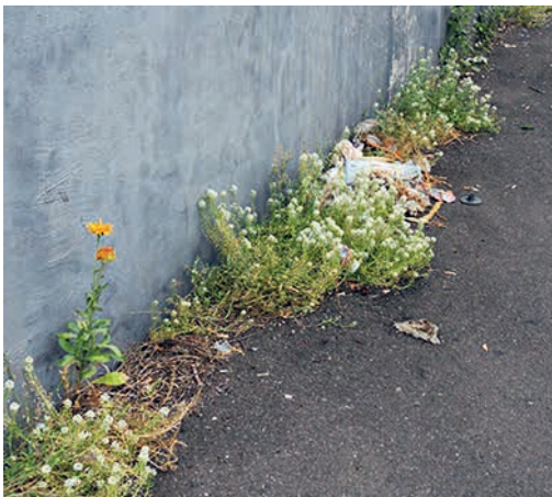
Abb. 8: Lobularia maritima (Strand-Silberkraut) und Calendula officinalis (Garten-Ringelblume) auf einem Bürgersteig in Köln-Worringen (18.09.2016).

Teil in den Samenmischungen sogar aus Überschüssen sonstiger Produktionen, die sich in den undefinierten Mischungen noch gut vermarkten lassen.