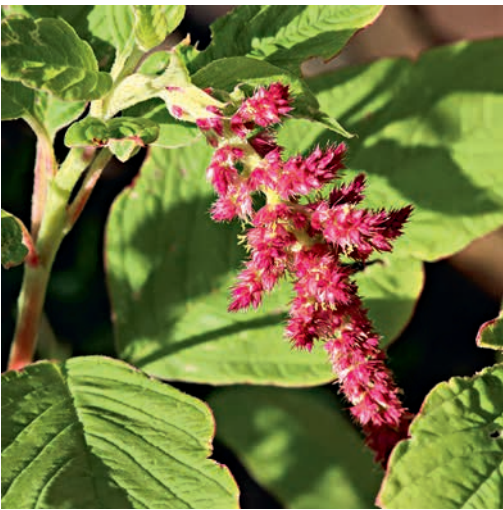
Abb. 5: Amaranthus caudatus (Garten-Fuchsschwanz, Bochum, 30.07.2018).

im Repertoire der Sommerblumen erwerben kann. Die in den Mischungen bemerkenswerterweise fast durchweg einjährigen Arten stammten aus dem Mittelmeergebiet, aus Südosteuropa oder auch aus ganz anderen Florenregionen wie Nord- oder Mittelamerika (Abb. 3–9). Eine der wenigen heimischen Arten, die fast in jeder Bienenmischung auftritt, ist Centaurea cyanus (Kornblume), jedoch in verschiedenen Farbvarianten von Weiß über Rosa bis zum gewohnten Blau. Weitere