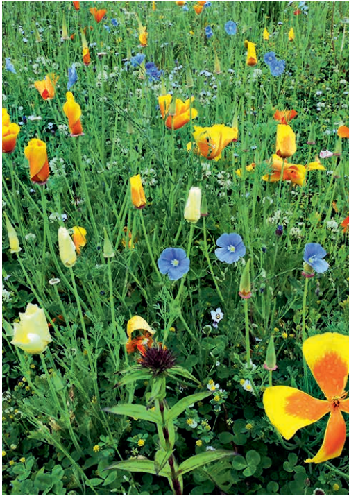
Abb. 10: „Einjährige Wiese“ aus der Samentüte mit verschiedenfarbigem Kalifornischem Kappenmohn, Bart-Nelke und Lein, Bielefeld, 05.06.2016).