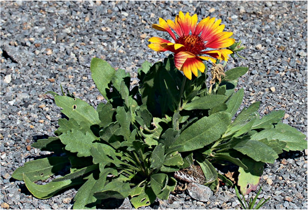
Abb. 9: Gaillardia aristata (Prärie-Kokardenblume) auf der Halde Rheinelbe in Gelsenkirchen (21.07.2017).

an einem Ort. In solchen Fällen kann davon ausgegangen werden, dass der Standort Opfer einer Guerilla Gardening-Aktion wurde. In vielen Fällen bleibt dies jedoch völlig unklar, z. B. wenn nur einzelne Arten bzw. Pflanzen auftreten oder diese an schlecht zugänglichen Orten wachsen.