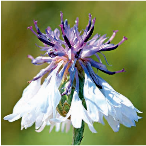
Abb. 4: Centaurea cyanus (Kornblume) mit weißen Randblüten (Mülheim/Ruhr, 18.08.2018).

regelmäßige Vertreter sind Agrostemma gracile (Zierliche Kornrade, Türkei, Israel), Amaranthus caudatus (Garten-Fuchsschwanz, Südamerika), Ammi majus (Große Knorpelmöhre, Mittelmeergebiet), Calendula officinalis (Garten-Ringelblume, Herkunft unbekannt), Convolvulus tricolor (Dreifarbige Winde, Mittelmeergebiet), Coreopsis tinctoria (Färber-Mädchenauge, Nord-Amerika), Cosmos bipinnatus (Schmuckkörbchen, Nord- & Mittel-Amerika), Dianthus barbatus (Bart-Nel-