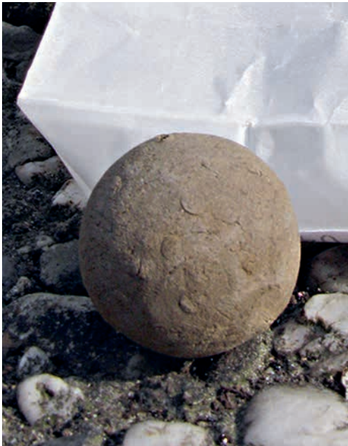
Abb. 2: Seedbomb im Rahmen des Guerilla Gardenings für eine buntere Stadt (Bochum, 20.05.2011).

so gut wie jedem Baumarkt, Discounter, aber auch auf Werbeveranstaltungen sind mittlerweile Samentütchen für „die Bienen“ erhältlich, die sich entweder für verhältnismäßig teures Geld oder aber als Maßnahme für einen ökologischen Anstrich von Firmen und Parteien gut unter die Leute bringen lassen. Ansprechende Namen wie Schmetterlingswiese, Bienenschmaus und Hummelmagnet auf einem attraktiven Cover mit bunten Blumen halten jedoch ihr ökologisches Versprechen nur selten.