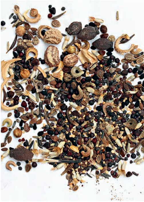
Abb. 1: Inhalt einer Samenmischung für eine Schmetterlingswiese aus einem Baumarkt (Mülheim, 28.04.2018).