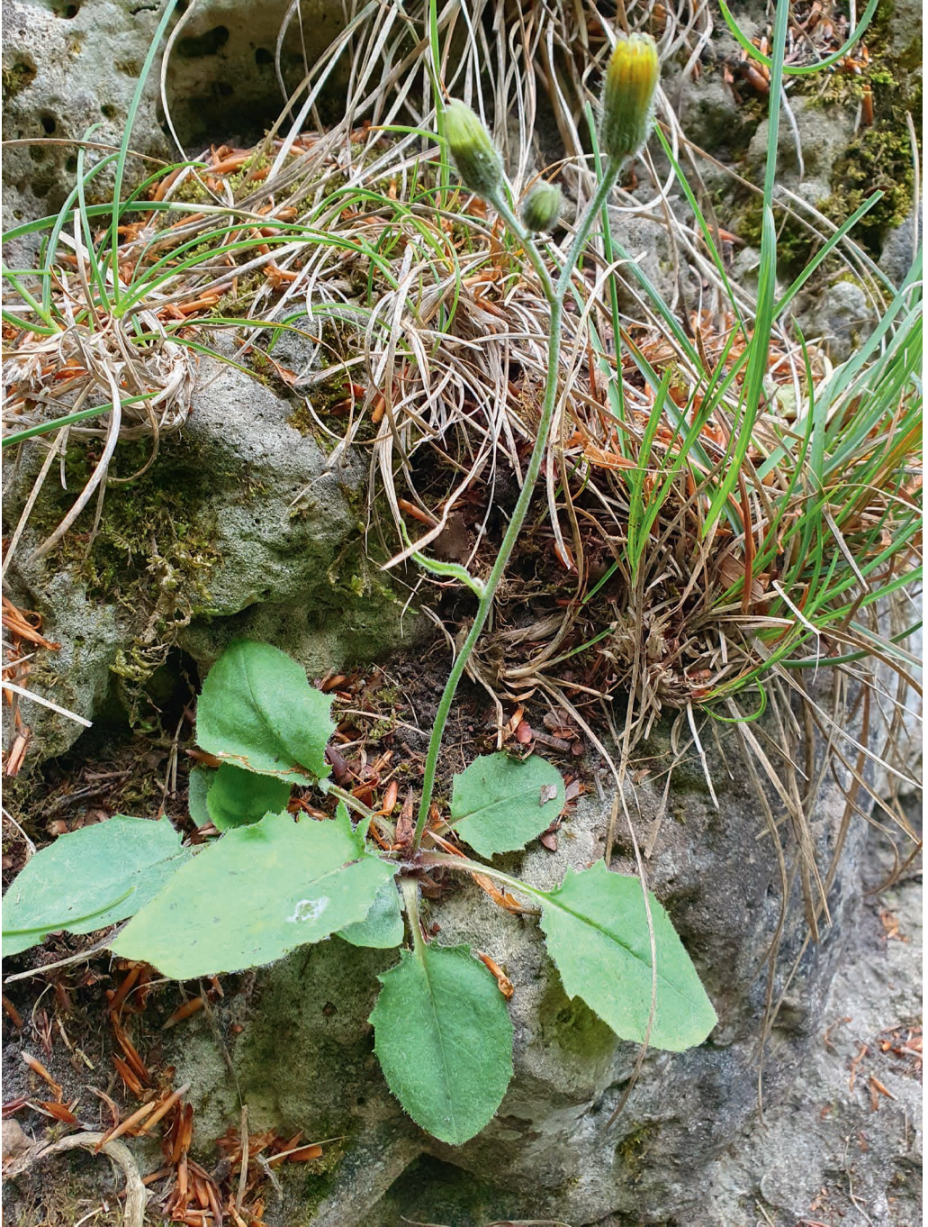
Abb. 3: Hieracium bifidum subsp. ithanum , Standort/Location. G. Gottschlich, 2.6.2023.