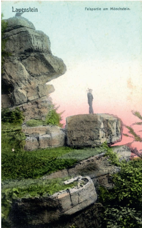
Abb. 6: Mönchstein am Ith um 1900, historische Postkarte. – “Mönchstein” [monk’s stone] on the Ith around 1900, historical postcard.

als jene, die auf der Postkarte dargestellt sind (bspw. höhere Luftstickstofffrachten, extremere Wetterereignisse wie aufeinander folgende Dürrejahre), ist hierbei vorsichtig vorzugehen. Andernorts im Weserbergland, so z. B. am Wittekindsberg westlich der Porta Westfalica, ist nach flächenhaftem Absterben der Überhälter durch Trockenstress eine Ausbreitung von Nitrophytenfluren und/oder Lianen- und Rubus -Gestrüpp zu beobachten. Somit könnte eine zu starke Freistellung negative Folgen für die zu schützenden Pflanzengesellschaften haben. Im Idealfall sollten Fällungen mit einem Maßnahmen- und Populationsmonitoring einhergehen, um möglichen Fehlentwicklungen rechtzeitig zu begegnen.