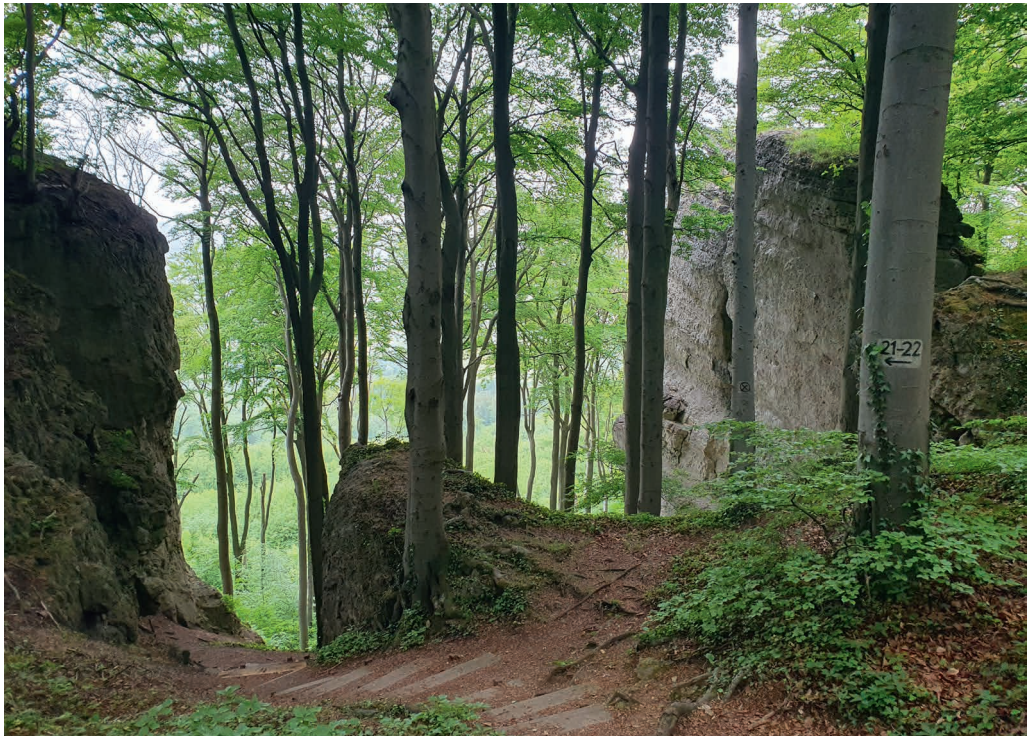
Abb. 5: Ith-Kamm mit durch Buchen beschatteten Kalkfelsen. – Ith ridge with limestone cliffs shaded by beech trees. G. Gottschlich, 2.6.2023.