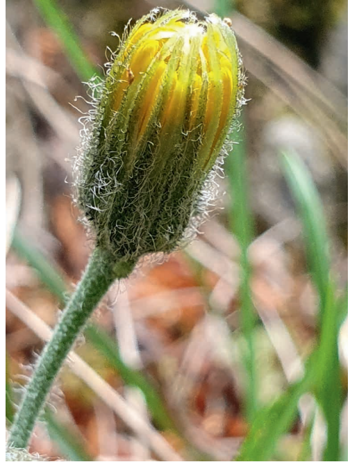
Abb. 4: Hieracium bifidum subsp. ithanum , Einzelkorb/single capitulum.

Als notwendige Maßnahme für den hier erstmals bekannt gemachten lichtliebenden Lokalendemiten wären also punktuelle Freistellungen dringend erforderlich. Da dies aber zu anderen Umweltbedingungen geschieht