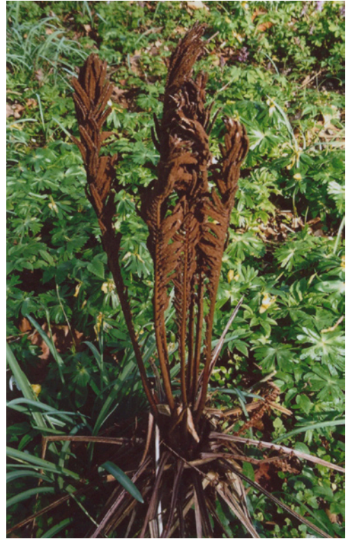
Abb. 5: Matteuccia struthiopteris : vorjährige fertile Wedel, umgeben von Eranthis hyemalis. Beetzendorf, Park I (Altmarkkreis Salzwedel), 11.03.2020

Ornithogalum nutans : Der Nickende Milchstern, kenntlich u.a. am fehlenden Zahn der inneren Leiste der Stamina, gehört mit O. boucheanum zum O. nutans agg. Da bei der Kartierung oft keine Trennung der sehr ähnlichen Arten vorgenommen wurde, liegen im Deutschland-Atlas keine getrennten Verbreitungskarten vor. Außerdem kommt noch hinzu, dass das Kreuzungsprodukt beider Arten ( O. × vigenieri ) bisher nicht berücksichtigt wurde (NETPHYD &