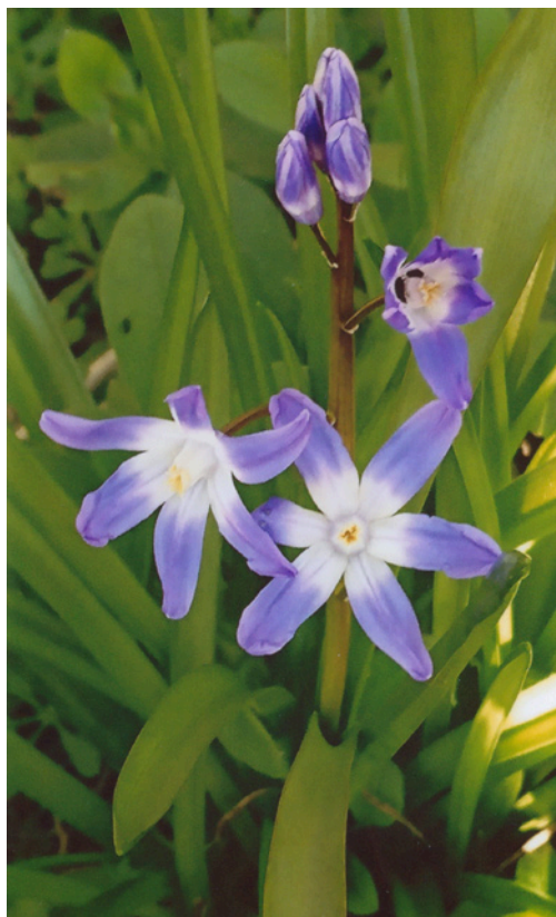
Abb. 8: Scilla siehei : Blüten mit deutlich abgesetzter weißer Mitte. Beetzendorf, Park I (Altmarkkreis Salzwedel), 11.03.2020

Neben typischer Ausbildung des ‚Auges‘ treten auch Phänotypen mit wesentlich kleinerer weißer Mitte auf. Im Park Weteritz bilden Scilla sardensis und S. siehei einen Mischbestand, der das Gelände nördlich des Schlosses (ca. 500 m 2 ) besiedelt und von weiteren Stinsenpflanzen begleitet wird. Auch diese Population tritt mit variablen Blütenmerkmalen in Erscheinung, wobei Ex. mit rein weißer und deutlich abgesetzter Mitte in der Minderzahl sind.