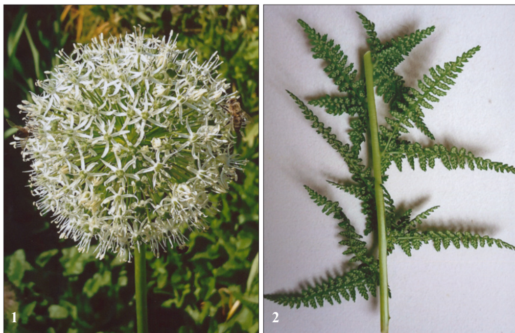
Abb. 1: Allium cf. stipitatum : Blütenstand. Schlosspark Kunrau (Altmarkkreis Salzwedel), 04.06.2021, Abb. 2: Athyrium filix-femina 'Victoriae': mittlerer Teil eines Wedels (Unterseite) mit gitterartig angeordneten Fiedern. Beetzendorf, Park II (Altmarkkreis Salzwedel), 03.07.2020