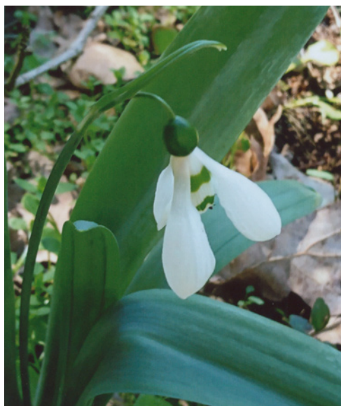
Abb. 3: Galanthus elwesii : blühende Pflanze. Schlosspark Krumke (Landkreis Stendal), 29.03.2021