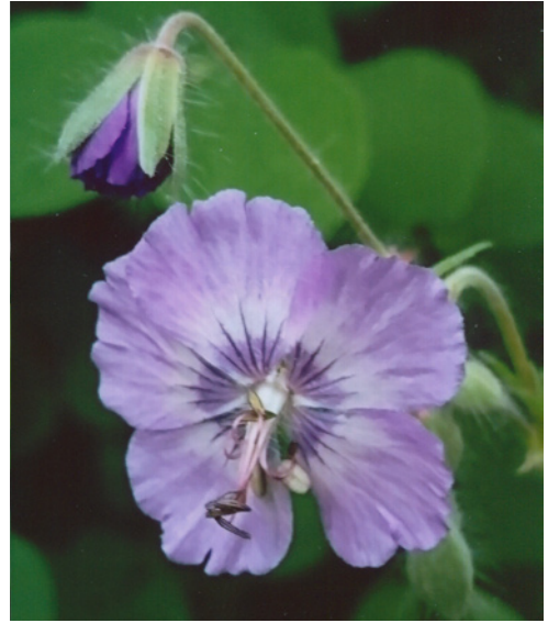
Abb. 4: Geranium phaeum subsp. lividum : Einzelblüte. Gutspark Weteritz (Altmarkkreis Salzwedel), 29.05.2020

Die Art wurde in drei Parkanlagen nachgewiesen. Im Beetendorfer Park I ist ein Wegrand am Übergang zum angrenzenden Wald mit etlichen Ex. besiedelt worden (14.05.2020). Der Bestand im Park II wird seit etwa 1980 beobachtet. Hier kommen auf einer nassen, baumfreien, aber locker verbuschten Fläche jährlich zahlreiche Ex. zur Entwicklung. Im Stadtpark Tangerhütte wurde im westlichen Bereich ein Vorkommen von ca. 20 Ex. auf einer aufgelichteten Fläche entdeckt (25.02.2020). Die sich daraus ergebende Frage, ob es sich bei den vorgestellten Populationen um Nachkommen einst gepflanzter Ex. (also um echte Stinsenpflanzen) handelt oder ob sie erst später eingewandert sind bzw. durch Gartenabfälle eingebracht wurden, kann jedoch nicht schlüssig beantwortet werden.