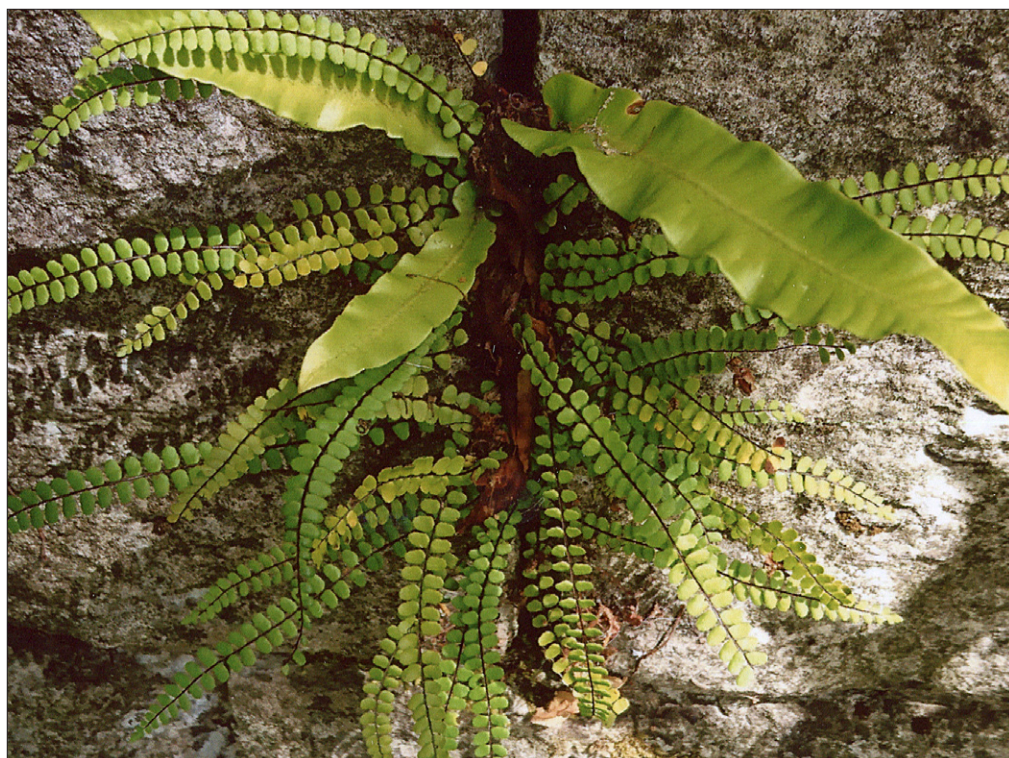
Abb. 7: Asplenium scolopendrium und A. trichomanes in einer Mauerritze eines Stützpfilers der Klostermauer in Schulpforte, 11.07.2022.

Dagegen ist Impatiens glandulifera in den 1950er Jahren am Saaleufer noch nicht beobachtet worden, gegenwärtig im Bereich Schulpforte aber häufig anzutreffen (z. B. 4836/144; 11.07.2022).