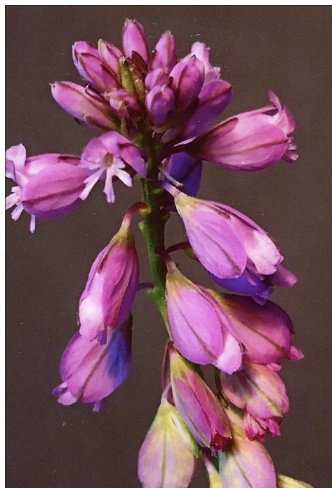
Abb. 6: Polygala comosa. Oberer Teil des Blütenstands. Lichter Hangwald (Platten) O Bad Kösen, 13.05.2022.

An allen Exkursionstagen wurde vom Smyrniium perfoliatum -Hauptvorkommen einem Pfad hangaufwärts gefolgt, vorbei an etwa 100 blühenden Orchis purpurea und Sorbus torminalis in allen Altersstufen, aber auch an Hippocrepis comosa und Polygala comosa (Abb. 6). Darauf, im mehr ebenen, von Rotbuchen dominierten und von Buglossoides purpurocaerulea , Lathyrus vernus und Melica uniflora besiedelten Gelände gelangt man wieder auf die Kohlenstraße. Unweit öffnet sich der Wald und gibt den Blick frei auf einen südexponierten, schon in den 1950er Jahren aufgelassenen Weinberg/Obstgarten (jetzt als Gaudigs Berg ausgeschildert; 4836/431). Die Örtlichkeit, während meiner Schulzeit oft aufgesucht, hat sich in der Zwischenzeit nur wenig verändert. Selbst Helieborus foetidus , dort am 07.05.1954 nachgewiesen, konnte am felsigen Oberhang, begleitet von Dianthus carthusianorum , Dictamnus albus , Hippocrepis comosa , Primula veris , Salvia pratensis , Silene nutans , Sorbus torminalis , Vinca minor und Vincetoxicum hirundinaria , in mehreren juvenilen (2022 auch fertilen) Ex. wiedergefunden werden.