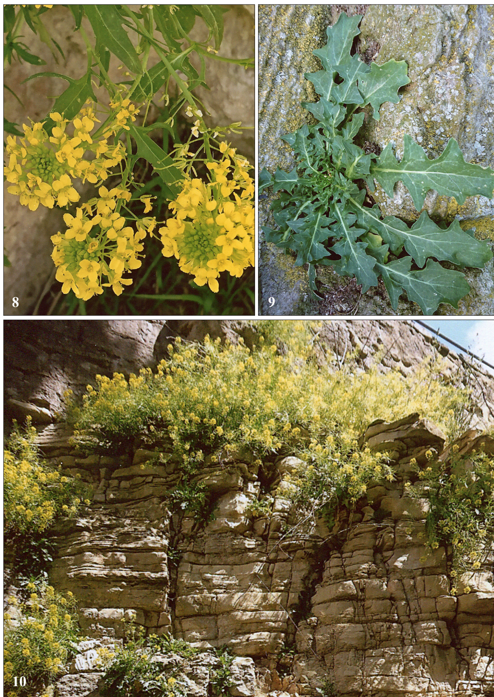
Abb. 8–10: Sisymbrium austriacum, Ruine Rudelsburg bei Bad Kösen, 15.05.2022. – 8: Herabhängende Blütentriebe am Mauerwerk der Ruine Rudelsburg. – 9: Blattrosette auf einem Mauertorso der Ruine Rudelsburg. – 10: Anstehender Muschelkalk mit üppigem Bewuchs.