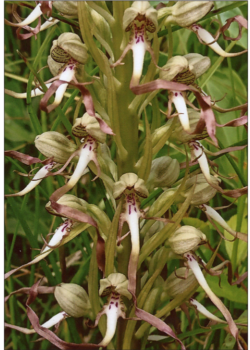
Abb. 3: Himantoglossum hircinum. Detail des Blütenstands. Wegrand in den Weinbergen (Äpplerberge) NW Almrich, 20.05.2022.

Etwas weiter südlich wurde in einer flachen Erosionsrinne ein weiteres, aber nur 20 Ex. umfassendes Vorkommen unter jüngeren Bäumen von Acer platanoides und Fraxinus excelsior inmitten eines Mercurialis perennis -Teppichs entdeckt. Hier wurde die Gelbdolde von Aegopodium podagraria , Alliaria petiolata , Daphne mezereum , Hedera helix , Lathyrus vernus ,