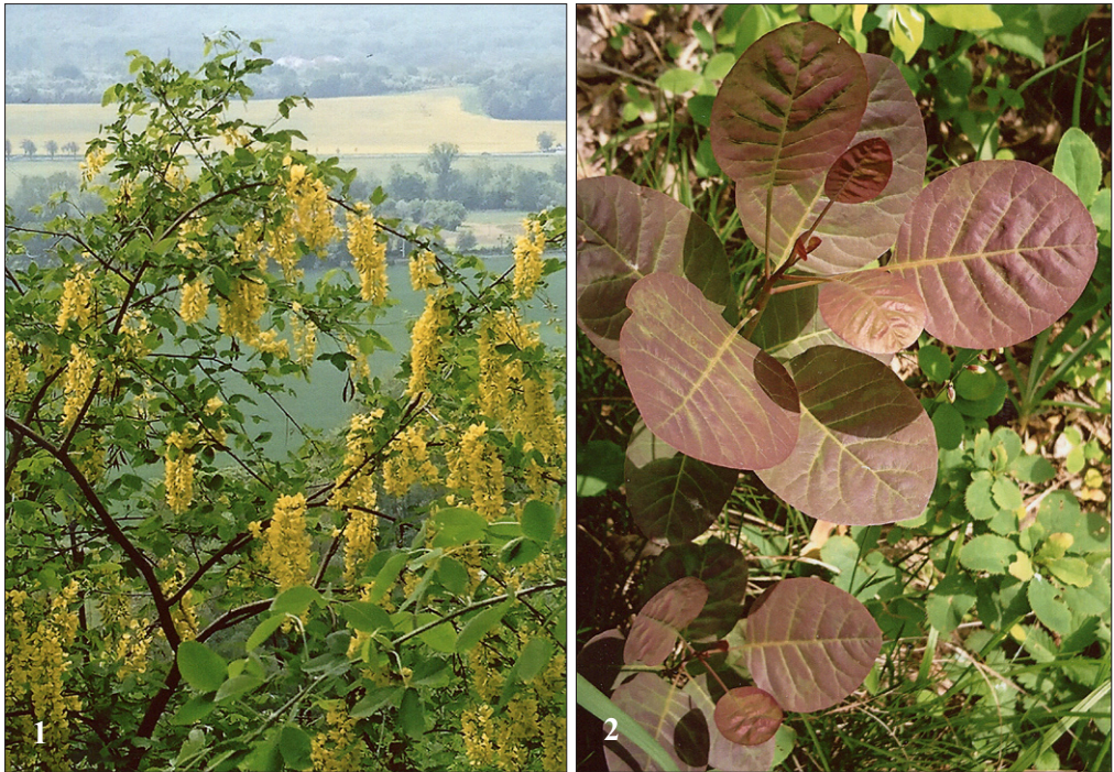
Abb. 1: Laburnum anagyroides. Blühender Strauch am Saalehang N Bad Kösen, 12.05.2022. Abb. 2: Cotinus coggygria. Jungpflanze mit spontaner Rotlaubigkeit. Saalehang N Bad Kösen, 20.05.2023.