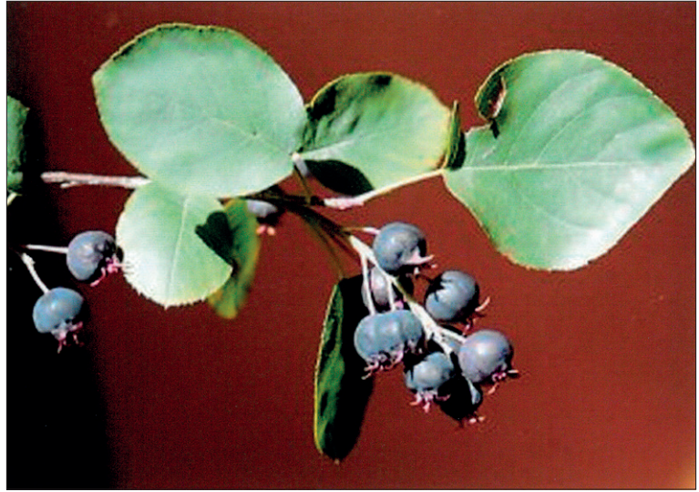
Abb. 5: Amelanchier spicata, fruchtend. Salzweidel, 10.7.2012

SO Kirche Seeben (O Friedhof), reich an Unterholz ( Frangula alnus , Sorbus aucuparia u.a.), mind. 8 ältere Ex., 14.4.2017.